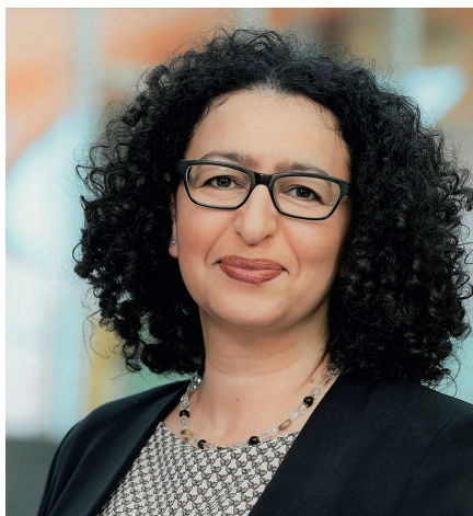
Univ.-Prof. Dr.-Ing. Lamia Messari-Becker fordert eine grundsätzlich andere Baupolitik.

Wir müssen wetterextremsensibel bauen. Klimaanpassung adressiert mehrere Ebenen - Bauwerke, Außenraum, Stadt, Landschaft und Infrastruktur - sowie unterschiedliche Wetterextreme (Hitze, Starkregen, Hochwasser, Dürre,