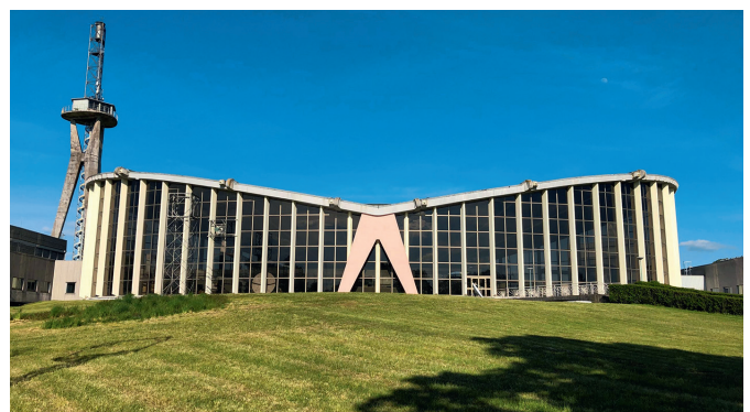
Die ehemalige Sendehalle von Radio Europe 1 im saarländischen Berus ist das neueste „Historische Wahrzeichen der Ingenieurbaukunst in Deutschland“.