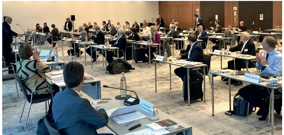
Die Delegierten bei der 68. Bundesingenieurkammer-Versammlung (BKV) im Berliner Novotel Hotel am Tiergarten.